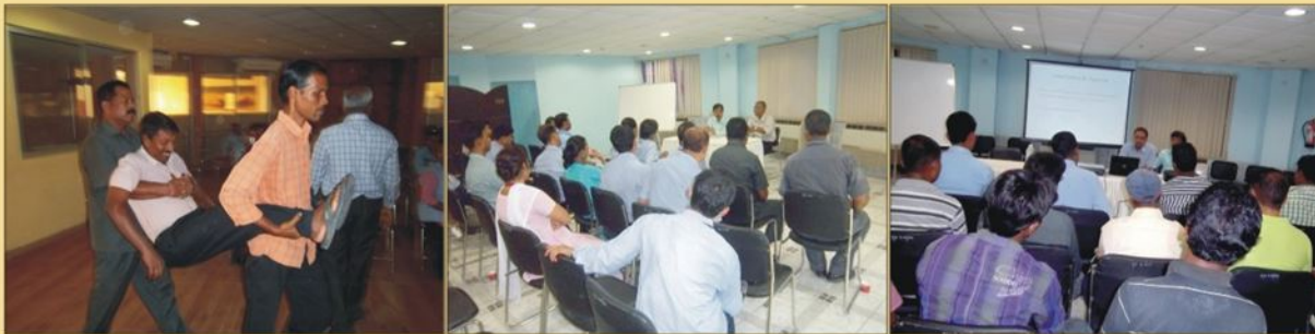
Fire Fighting & Emergency Preparedness & Usefulness of Application of PPE